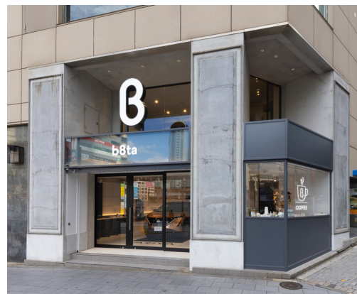
b8ta Tokyo - Shibuya外観